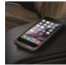
Espacio para carga inalámbrica