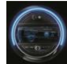
Pantalla central OLED con un área de 9.4"