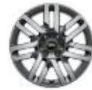
Rin de 17" Parallel Spoke Gris con pernos de seguridad